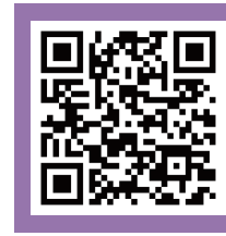
▲부스 넘버 순 참가업체 리스트